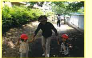
◆地域の見守りの中で散歩に行ったり、行事と一緒に参加したりします。