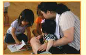
◆在宅子育て支援(ビヨビヨひろば)で親子で来園して一緒にあそびます。