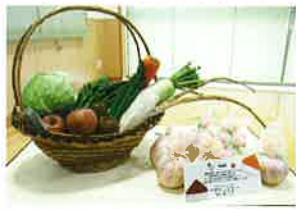
◆自然の恵みに感謝(感謝祭)