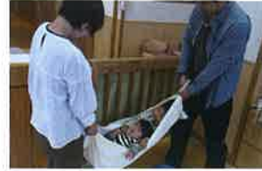
◆お父さん、お母さんと一緒に(交流懇談会)