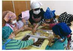
◆まるめてならべてクッキー作り