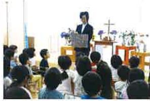
◆花のように愛らしく(花の日)