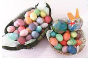
◆神様の復活を祝って(イースター)