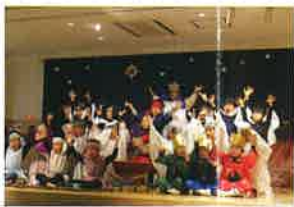
◆神様からのおくりもの(クリスマス会)