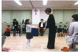
◆こころもからだも大きくなったね(卒園式)